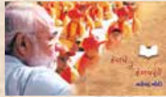
કેળવે તે કેળવણી