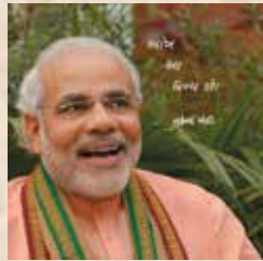
આંખ આ ધન્ય છે

સંવેદનશીલ કર્મચોગી નરેન્દ્ર મોદીની ડાયરી રૂપે લખાયેલી આ પ્રાર્થનાઓ છે. ...બધું જ જ્યારે ડહોળાયેલું હોય ત્યારે કઈ રીતે નિર્મળ, સ્વચ્છ, પારદર્શક અને સ્પષ્ટ વાતાવરણ ઊભું કરવું એની વાત અત્યંત સહજતાથી અહીં થઈ છે.